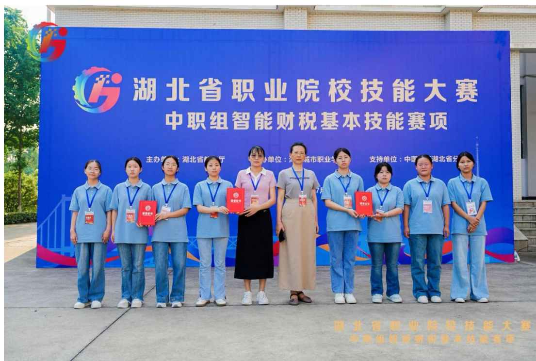
图 6 承办湖北省职业院校技能大赛中职组智能财税基本技能赛项