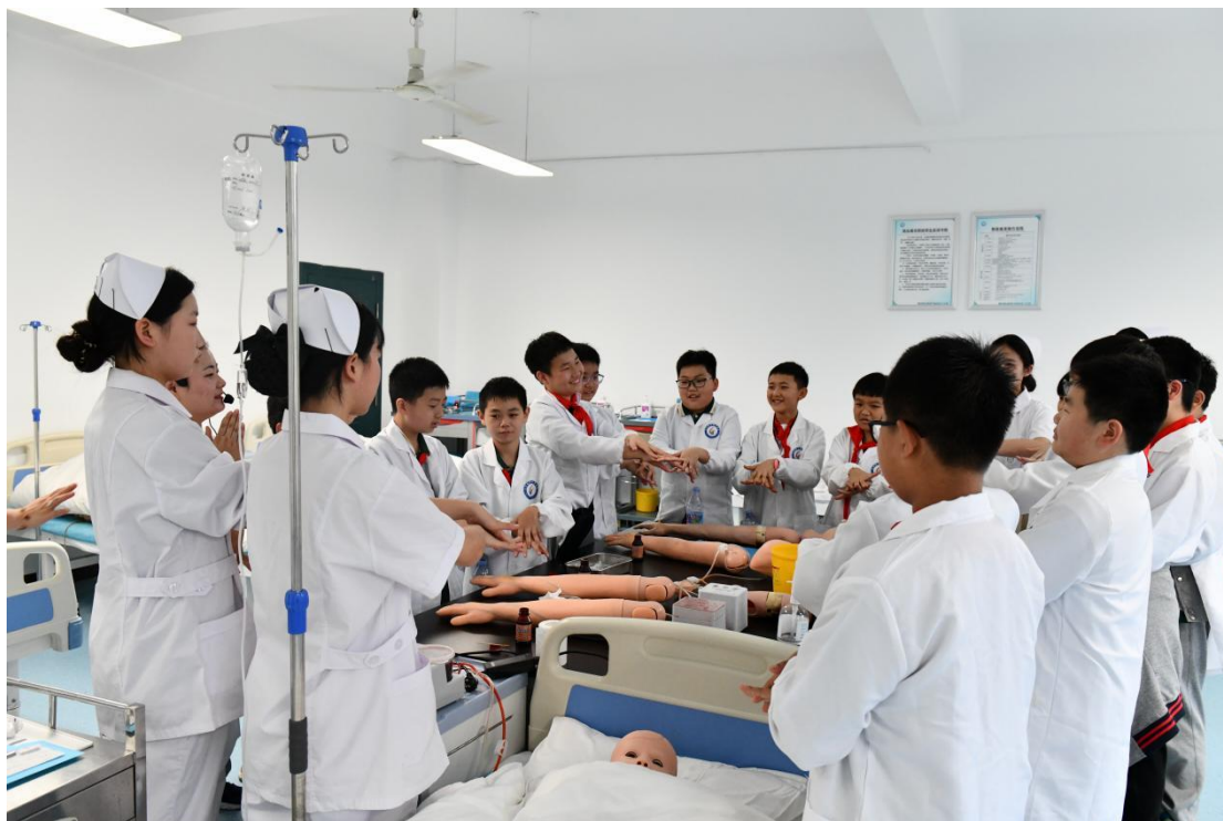
图 8 中小學生职业体验活动-护理急救师体验现场