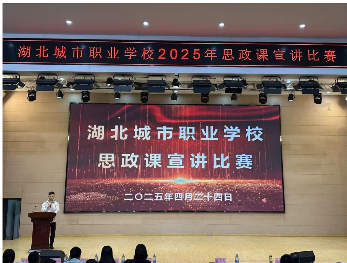
图 17 湖北城市职业学校 2025 年思政课宣讲比赛