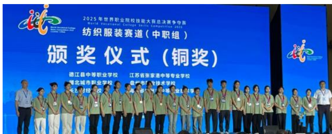
图 16 湖北城市职业学校在 2025 年世界职业院校技能大赛总决赛争夺赛纺织服装赛道（中职组）获得铜奖

学校将以此为契机，持续完善“以赛促教、以赛促学、以赛促改”机制，加强技术技能锤炼与团队协作，为职业院校提升育人质量、服务区域发展提供可复制的典型经验。