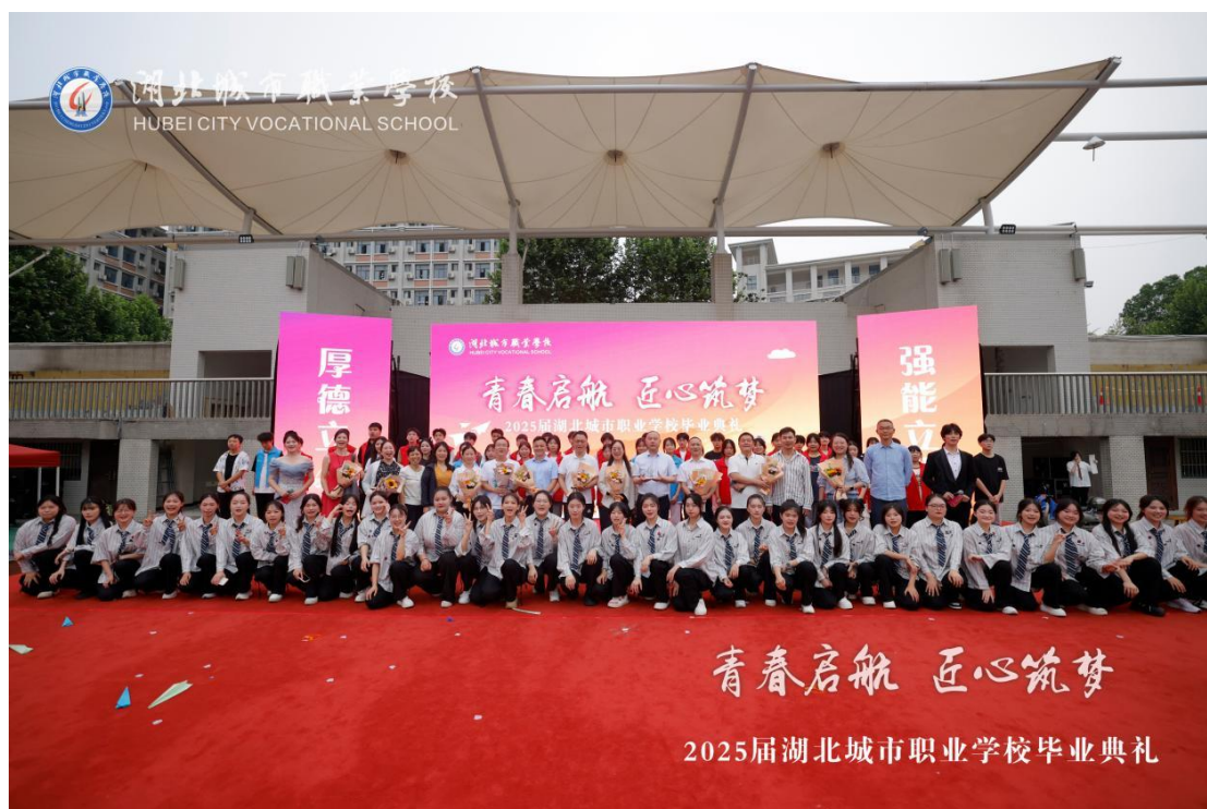
图 2 学校 2025 届毕业典礼合照