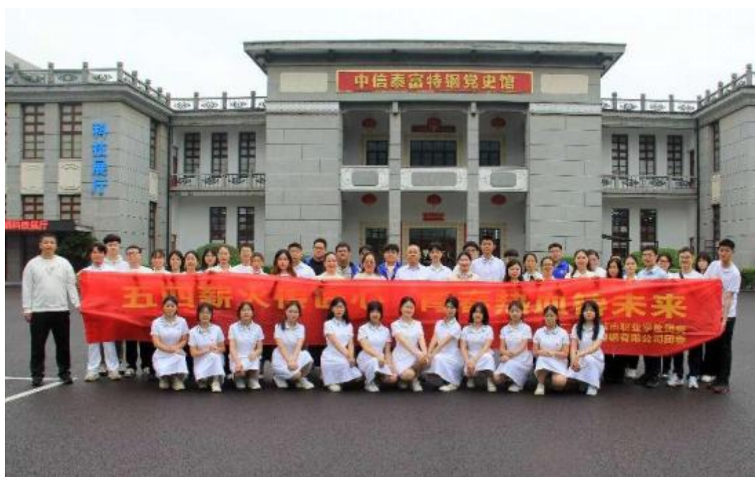
图 3 学校与大冶特钢公司联合开展了“五四薪火传匠心 青春热血铸未来”主题团日活动

色的理解，激发了将个人成长融入国家发展的内生动力。它生动展示了学校在构建“思政引领、产教融合”育人模式上的有效实践，为培养兼具家国情怀与精湛技艺的新时代青年技能人才提供了鲜活载体。