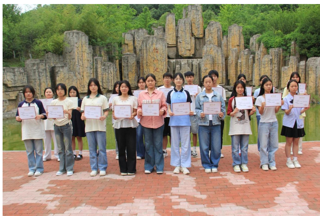
图 12 学校举行新团员入团仪式暨五四表扬大会

本次活动通过庄严的仪式感和鲜活的榜样激励，有效强化了团员青年身份意识、荣誉感和责任感，进一步筑牢了青年学生“听党话、跟党走”的思想根基。它集中展示了学校共青团工作的活力与成果，是学校构建“三全育人”格局、培养德技并修时代新人的生动实践。